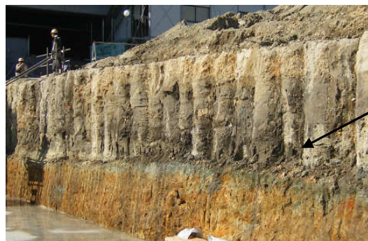
岩盤層着底(Dタイプ)